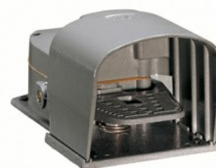
Interruttori a pedale singolo, con movimento libero - Chiusa KR200